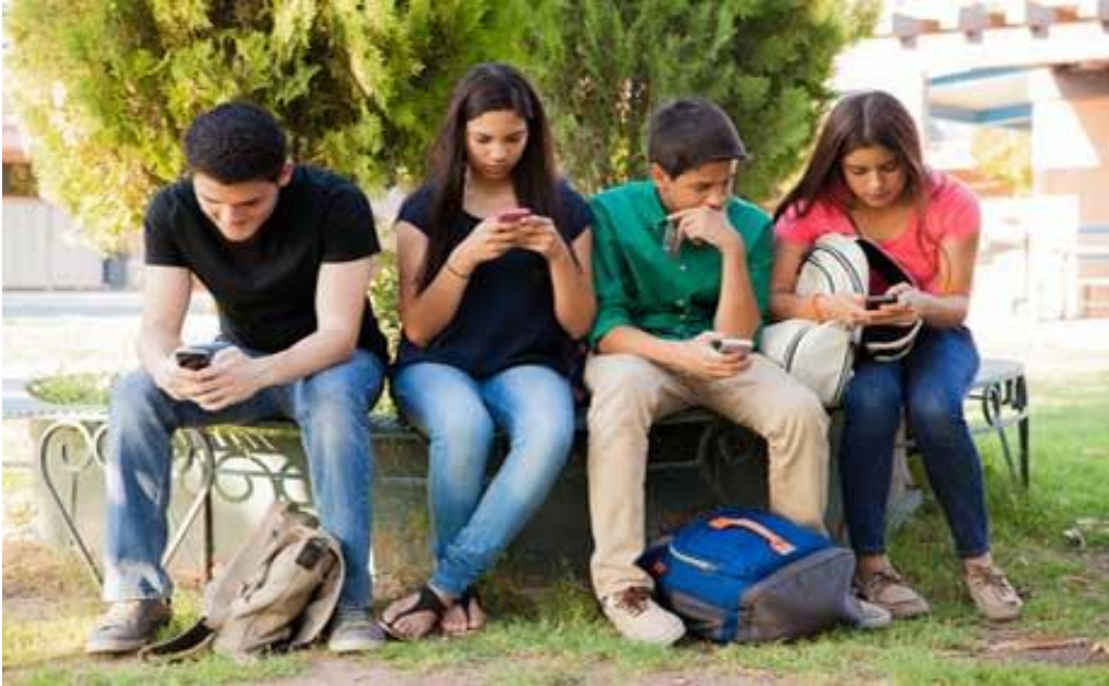
Die heutige Welt ist vernetzt