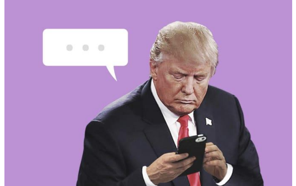
Staaten werden digital regiert